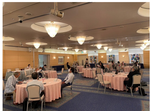
今回は円卓で行われました。